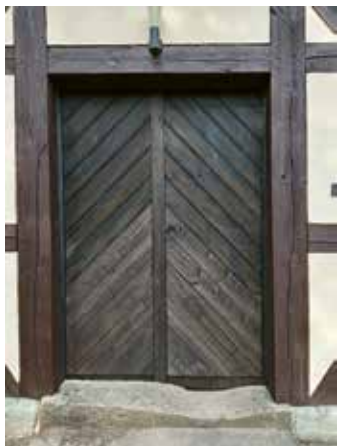
Durch Spenden unterstützt: Sanierung der Kirche Blumberg

Auf Wunsch stellen wir selbstverständlich eine Spendenbescheinigung aus.