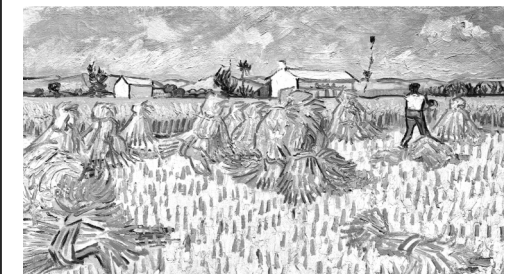
Ernte in der Provence – Gemälde von Vincent van Gogh (1887)

Zitat: „Solange die Erde steht, soll nicht aufhören Saat und Ernte, Frost und Hitze, Sommer und Winter, Tag und Nacht.“ (1. Mose 8,22)